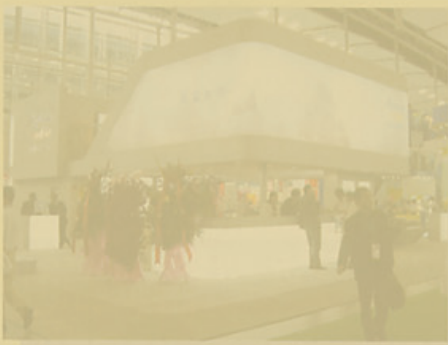
SABIC 拥有本届最大的独立展台。